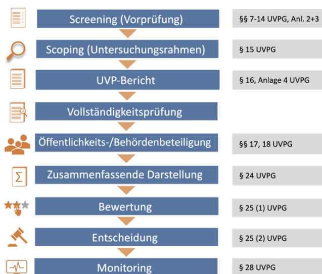
Abb. 1 Ablauf des UVP-Verfahrens

Ein häufiger Konfliktbereich von UVP-Berichten – insbesondere bei großen Infrastrukturprojekten – ist der Alternativenvergleich. Er sollte stets mit maximaler Transparenz hinsichtlich der Bewertungs- und Gewichtungsvorgänge durchgeführt werden. Hier sind regelbasierte Vorgehensweisen im Normalfall den stark individualisierten, verbal-argumentativen Techniken vorzuziehen.